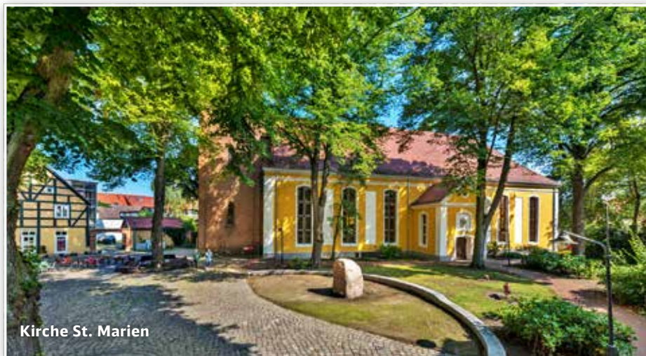
Kirche St. Marien

Vom Schloss führt die Straße am Rathaus auf die Ueckerstraße, der Sie rechts folgen. Das ist die Bummelmeile Ueckermündes mit schönen alten Häusern, Restaurants und Cafés. Werfen Sie rechter Hand ruhig einen Blick in die St. Marien-Kirche – sie steht bereits seit 1766 an dieser Stelle. Von einem Vorgängerbau ist ein Teil des Ratsgestühles erhalten geblieben, das aus dem Jahre 1593 stammt. Sehenswert in der Kirche