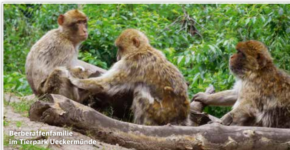
Berberaffenfamilie im Tierpark Ueckermünde