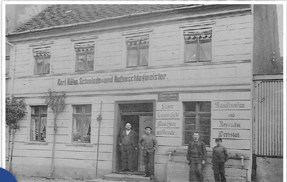
Schmiede Kühn um 1910