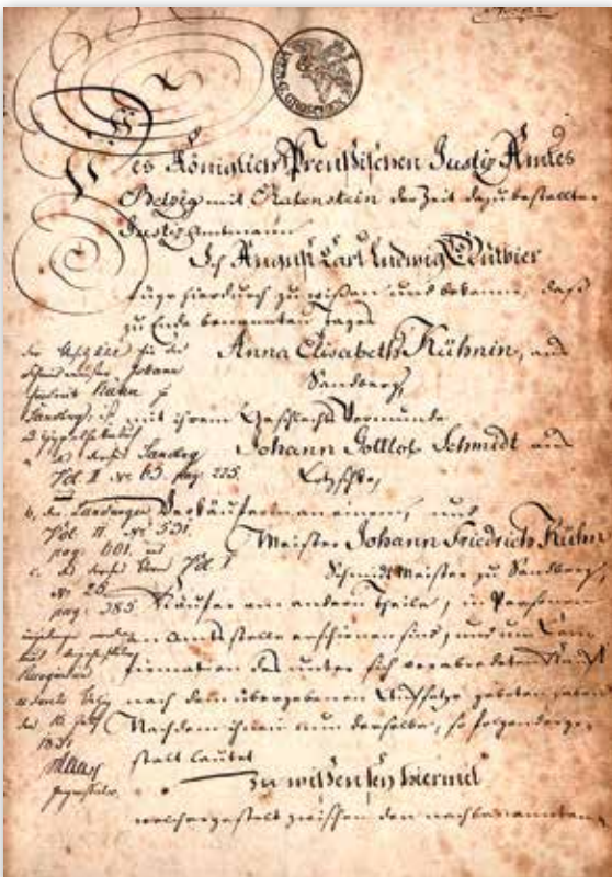
Seite aus einem Vertrag von 1816