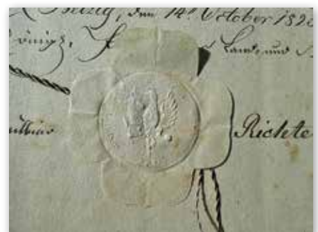
Prägiesiegel des Königlich-Preussischen Stadt- und Landgerichts 1825

(Anmerkung: Die alten Hohlmaße hatten regional sehr unterschiedliche Größen, können also nicht exakt angegeben werden. Scheffel z. B. in Brandenburg ca. 53 Liter; Metze: Hohlmaß zu 8 Pfund, d. h. 4 kg; Kanne: ca. 1-2 Liter; Quart: etwa 1 -1,5 Liter)